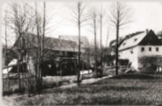
Frühere Bebauung am „Rennsteigkeller“

In der jüngeren Geschichte diente der Keller dann tatsächlich als Lager für allerlei Dinge und in der Zeit des II. Weltkrieges auch als Luftschuttkeller. Danach geriet er in Vergessenheit. Erst kürzlich wurde er wieder erschlossen.